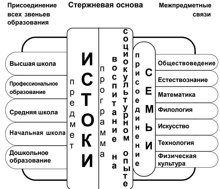
Рис. Образовательная область ИСТОКОВЕДЕНИЕ

ИСТОКОВЕДЕНИЕ — междисциплинарное, интегрирующее направление в образовании и науке, направление, утверждающее духовно-нравственный потенциал России.